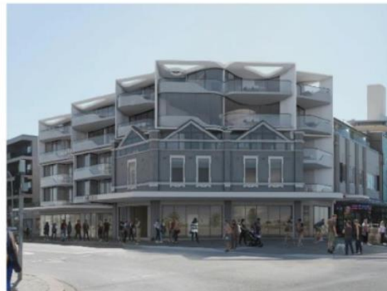
Кэмпбелл Парад, Bondi

Сторчелли архитектур / Северно Уэльсфорд