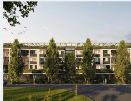
Ферни Гроув Сентрал, Брисбен Honeycombes Property Group