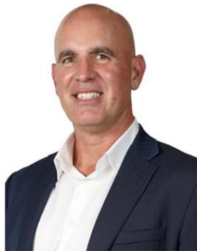
Брюс Ван 1