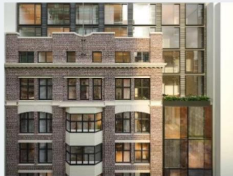
Отель "Эйс", Сиднейская группа "Золотой век"