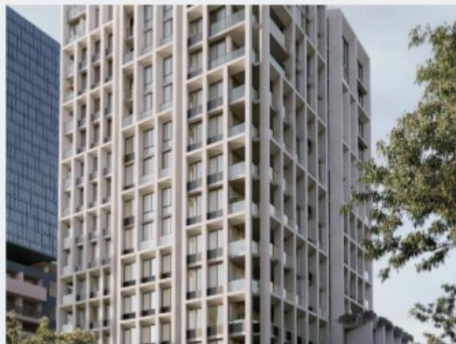
Чатсвуд, Новый Южный Уэльс 1 , Центральный элемент